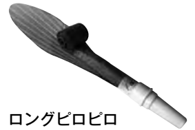
ロングピロピロ 830円(税込)