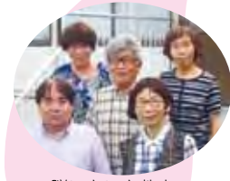
脳いきいき教室 マスター勢ぞろい!