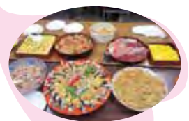
香美支部新年会の持ちよごちそう