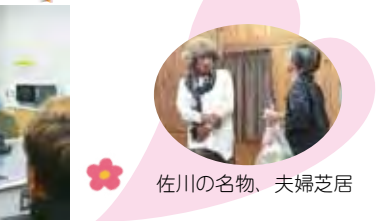
佐川の名物、夫婦芝居