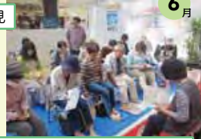
フジグラン朝倉店で健康講座