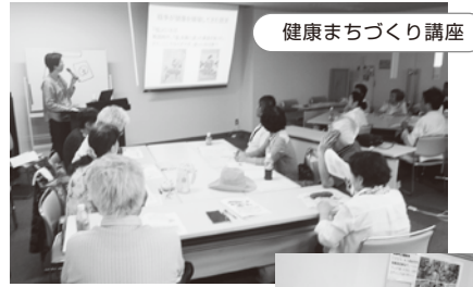
健康まちづくり講座

7月22日 高知市の支部から26名が参加しました。高知医療生協の歴史や、現在取り組んでいる様々な取り組みについて、学習と交流を深めました。