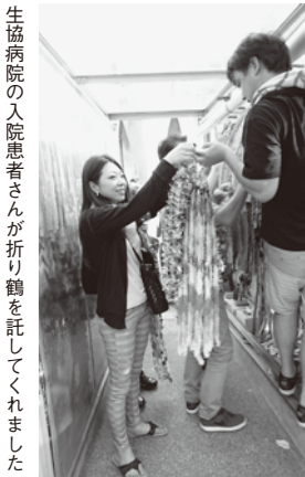
生協病院の入院患者さんが折り鶴を託してくれました