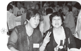
すさき、大野見、 窪川、四万十、土佐清水からも お祝いにかけつけま たしていただきました。