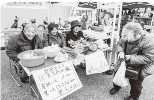
各班からの出店があり、地域の方もたくさん来られました