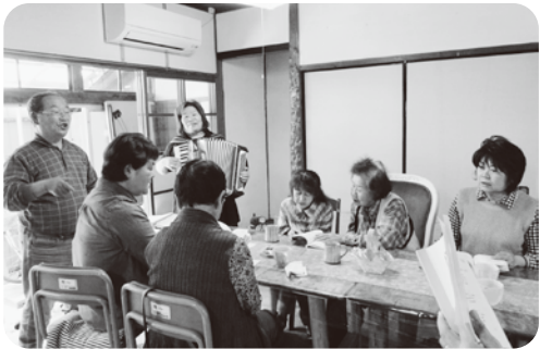
声を出して歌うと気持ちいい

香美支部が地域にたまり場をつくらうと構想して三年。土佐山田地区に組合員サポートセンターをつくらうと、手分けして地域の空き家をまわりました。見つけた空き家はリフォーム済みで、支部の役員会をしていた建物の隣に位置するまさに地域の中心地。立地条件は、支部が望んでいた通りのものでした。