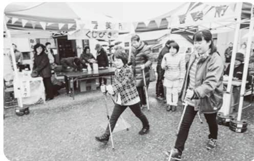
高齢者のためのミニボールウォーキング教室

ほかにも、ボールウォーキング教室(偶数週・月二回)、なんでも相談会(月一回)が定例で開催されています。きてみい家を班会の会場に利用することもあります。昨年できた三つの新しい班は、すべてきてみい家を利用しています。いつでも気兼ねなく集まることが出来ます。また、二九ある班と支部