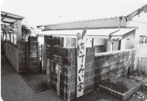
手づくりの看板が迎えてくれます