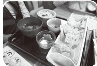
手づくりの竹皿には 揚げたてサクサクの 天ぷら