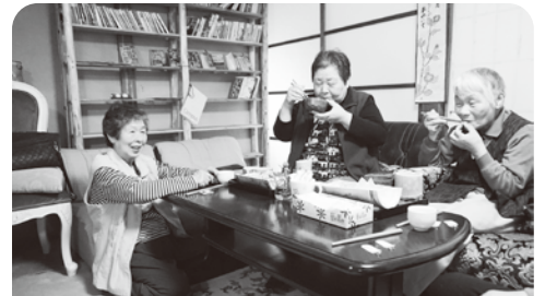
みんなで食べると おいしいね

「独りぼっちを作らない」「認知症になっても住み続けられる」そのためには地域の人が集う「たまり場」が必要です。香美支部は高知医療生協の「ふれあいの場」づくり補助金制度を活用し、一月に組合員サポートセンター「きてみい家」を開設しました。