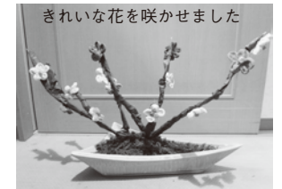
きれいな花を咲かせました

「運転できないと、孫と釣りとかドライブに行けれん。妻の送り迎えにも絶対必要」と話されました。