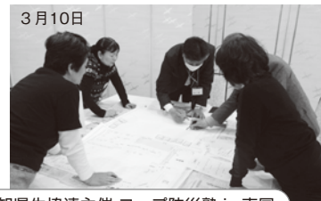
高知県生協連主催 コープ防災塾 in 南国

南国支部からたくさんの組合員が参加しました。避難所運営訓練(ボランティアの一員となって避難して行く住民の対応する訓練)をしました。机上の体験ですが、するとしなやかでは災害時に大きな差が出そうです。