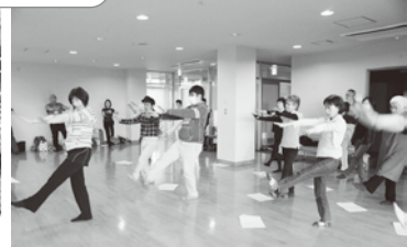
よさこい鳴子踊り体操