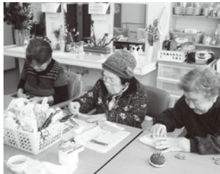
指先を使った創作活動