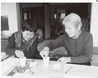
ます。特に、高知市西ブロックを重点とします。