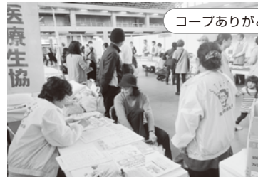
コープありがとうフェスタ ぎばさんセンター

3月5日、こうち生協30周年記念を祝いイベントがあり、高知医療生協も参加しました。足指力測定とみそ汁の飲み比べで、多くの方に医療生協の健康づくり活動を知ってもらおう機会となりました。