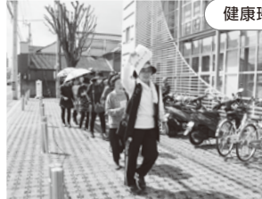
現地企画「あさひまちウォーク」