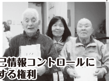
自己情報コントロールに関する権利

自分史作りから、そのひとらしさを大切に、一人一人の意思を大事にした、 尊厳を守る介護 を行っています