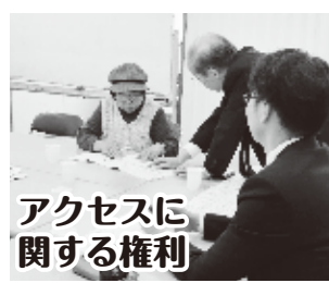
アクセスに関する権利

生活困難、労働問題、多重債務、生活保護、相続相談など、身近な問題が、身近な場所で開催されています。毎年続けてきた相談会には、昨年九二件の相談が寄せられました。不安や悩みを抱えて続けて