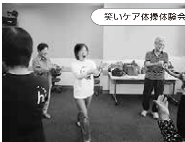
笑いケア体操体験会

地域の自治会と日高支部の呼びかけで、6名の男前が参加しました。女性3名の手ほどきを受けながら卵焼きに挑戦し、出来あがった料理をおいしく頂きました。