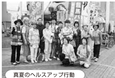
真夏のヘルスアップ行動

はりまや橋商店街、グリーンロード、ひろめ市場に分かれ、ヘルスアップ60日のパンフレットと乳がん日曜検診のお知らせをしました。中にはくわしく聞かせてほしいと興味をもってくれた方もいました。