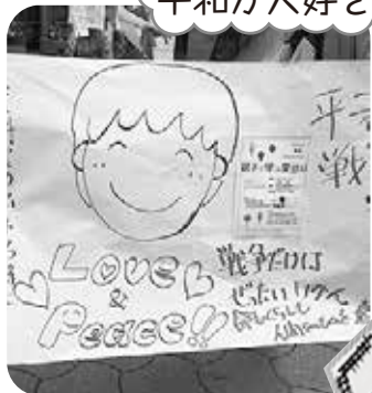
「安保法案を廃案に！ 8.23市民集会」高知市 藤並公園にて