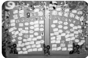
生協病院の待合ロビーでの「憲法9条違反はさせない！」コーナーでは、来院の方や組合員、職員に平和への願いを書いてもらい掲示しました。