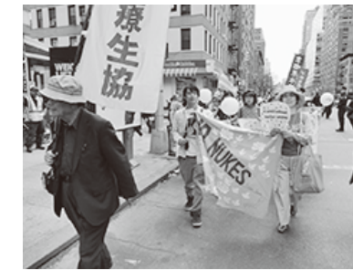
1万人の行進で核兵器の廃絶を訴えました

民社会グループとの関わりを深めるように促したい。彼らはNPTの規範を強め、軍縮を促進するうえで重要な役割を果たしている。二〇一五年NPT再検討会議議長と国連は、この市民社会グループからの会議の成功と核兵器廃絶をよびかける何百万もの署名を受け取った。これは、われわれが服務する人々の希望と期待とを力強く想起させるものだ。私は彼らの原則的なこの努力に全面的な支持を誓いたい。被爆者たちは、核兵器の恐るべき