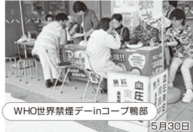
WHO世界禁煙デーinコープ鴨部 5月30日 高知県から健康増進グッズを借りて、生活習慣の改善を呼びかけました。肺年齢の測定では、実年齢より上か下かで一喜一憂。参加者に喫煙者はいませんが、禁煙は他人事ではありません。