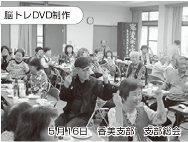
脳トレDVD制作 5月16日 香美支部 支部総会 22班から57名の参加で開催されました。総会後の交流会では、香美支部独自で作成した「楽しい脳トレ遊び」のDVDで盛り上がりました。