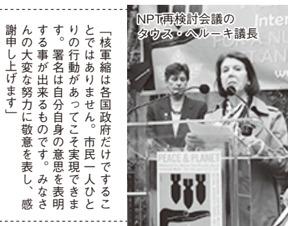
NPT再検討会議のタウス・ヘルキ議長 「核軍縮は各国政府だけでなく市民一人ひとりの行動があってこそ実現できません。署名は自分自身の意思を表明する事が出来るものです。みなさん大変な努力に敬意を表し、感謝申し上げます」