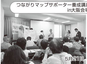
つながりマップサポーター養成講座 in大阪会場 5月21日 高知からは3名が参加しました。地図を使って地域資源や人と人のつながりを「見える化」していきます。地域に目を向けるきっかけづくりとして、活用していきたいと思っています。