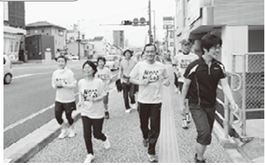
5月23日 反核・脱原発をめざして高知市内23キロを走破しました。最後は13人で平和行進に合流し、高知市役所前で集会に参加しました。

反核・脱原発をめざして高知市内23キロを走破しました。最後は13人で平和行進に合流し、高知市役所前で集会に参加しました。