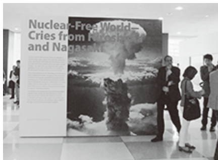
国連本部のロビーで開催された「原爆展」の様子

私はいまこちらにきている。私はこれらの証言者が参加されていることに感謝し、現在の会議が彼らの警告に耳を傾け、結果を出すように求めよう。