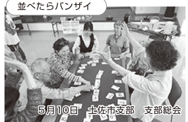
並べたらパンザイ 5月10日 土佐市支部 支部総会 午前中は、ALSOK防犯クイズ講座、午後はデイサービスせいきょうぬくぬくの職員による楽しいゲームで頭と体を使い楽しみました。写真は言葉ならべ競争の様子。