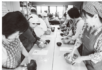
診療所で毎月1回体験班会!

支部が班に所属していない組合員さんに向けて、毎月1回多彩なメニューで体験班会をひらきました。支部ニュースで呼びかけ、料理が好きな組合員さんが集まり、2ヶ月に1回料理班会をやろうと、班を作りました。時々は公開にして別の班の人も誘っています。