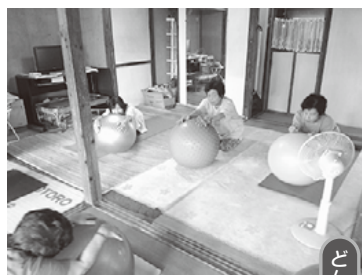
「お腹を何とかしたい」

山の上の仲間たち班の比較的若い組合員さんと健康づくりについて話をしていたら「お腹のお肉をなんとかしたい」と。家にボールもあるということになり、4名で班結成になりました。