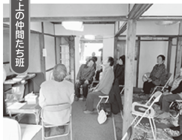
山の上の仲間たち班