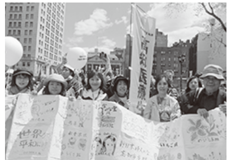
集会に参加した高知県の代表団 日本からは総勢1,058人が参加

民社会グループとの関わりを深めるように促したい。彼らはNPTの規範を強め、軍縮を促進するうえで重要な役割を果たしている。二〇一五年NPT再検討会議議長と国連は、この市民社会グループからの会議の成功と核兵器廃絶をよびかける何百万もの署名を受け取った。これは、われわれが服務する人々の希望と期待とを力強く想起させるものだ。私は彼らの原則的なこの努力に全面的な支持を誓いたい。被爆者たちは、核兵器の恐るべき