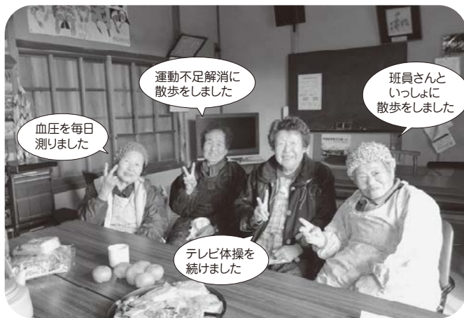
鏡支部横矢班のみなさん。全員がヘルスアップ60日を達成しました!

後援をお願いした職場の職員や家族ぐるみの参加もたくさんありました。一〇歳以下の小さな子どもから九〇歳代のお年寄りまで、幅広く取り組まれました。高知市内の小学校では四