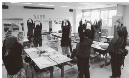
ヘルスアップ60日に参加した方を中心に、つながりを広げるヘルスアップ交流会 (旭北支部)