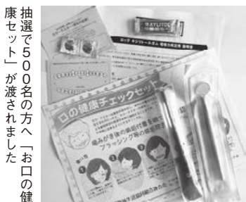
抽選で500名の方へ「お口の健康セット」が渡されました

日時 2015年6月28日(日) 10時~16時 場所 高知県立ふくし交流プラザ(朝倉)