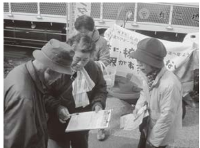
スーパー前で署名を訴えている様子(旭北支部)

10,000筆の核兵器全面禁止アピール署名とカンパを集めています。本部事務局までご連絡ください。