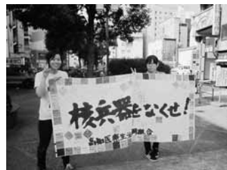
9月13日、職員がグリーンロードで街頭署名活動を行い、「核兵器全面禁止のアピール署名」を集めました。13名の参加で104筆が集まりました。