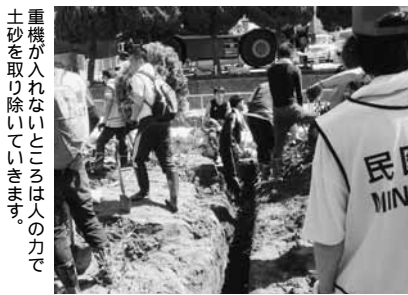
重機が入れないところは人の力で土砂を取り除いていきます。