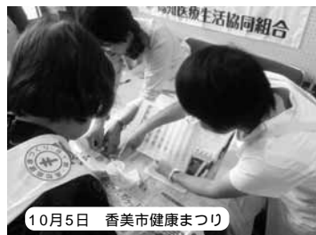
10月5日 香美市健康まつり