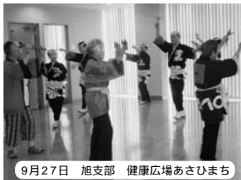
9月27日 旭支部 健康広場あさひまち

県社協の高齢者いきがい健康づくり支援事業として、10月から旭支部が主催する「健康広場あさひまち」のプレ企画がソレで開催されました。うたごえやよさこい囃子踊り・フラダンスなどが披露され、みんなで楽しむことができました。