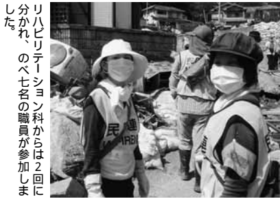
リハビリテーション科からは2回に分かれ、のべ七名の職員が参加しました。