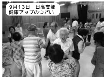
9月13日 日高支部 健康アップのつどい