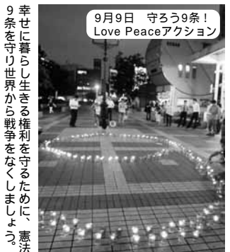
9月9日 守ろう9条! Love Peaceアクション