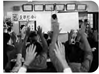
5月16日(金)朝倉みなみ支部 よさこい鳴子踊り体操...子どもの頃から 親しんだよさこいのメロディとリズムで よさこい!よさこい!