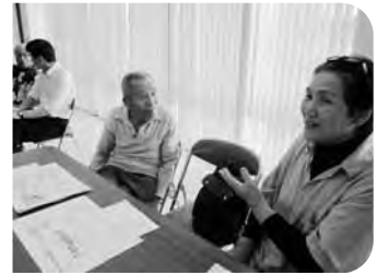
5月18日(日)土佐市支部 後半のクイズコーナーでは初参加の方から も出題がありました。