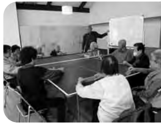
4月19日(出) 春野支部恒例の卓球バレーの様子 「いくわよっ」「えいっ」