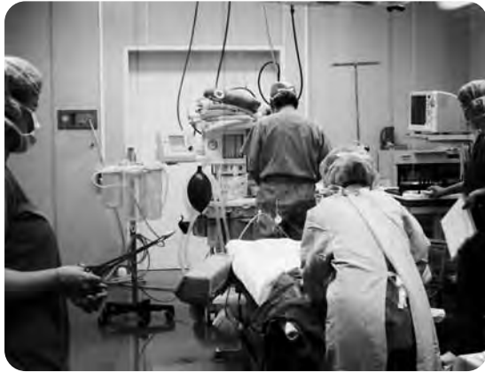
火曜日と金曜日の午後、手術が行われています。この日は大腸がんの手術が行われていました

高知医療生活協同組合 〒780-0963 高知市口細山206-9 TEL 088-843-0025 FAX 088-840-0649 発行責任者 今井好一 編集 「生活と医療」編集委員会 ホームページ http://www.kochi-hco-op.or.jp/ 定価 1部 30円 (組合員の購読料は出資金に含まれています)