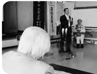
5月25日(日)土佐市なの花支部 「戸波・波介地域の震災被害と心構え」に ついてこうち防災備えちき隊の方から講 演をして頂きました。