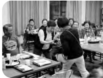
5月17日(出)香美支部 参加者52名で、じゃんけん、くじ引き、 歌と楽しく盛大に交流できました。