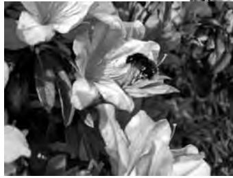
生協病院の屋上にはつじの花にハナアブが蜜を求めて飛び回っています