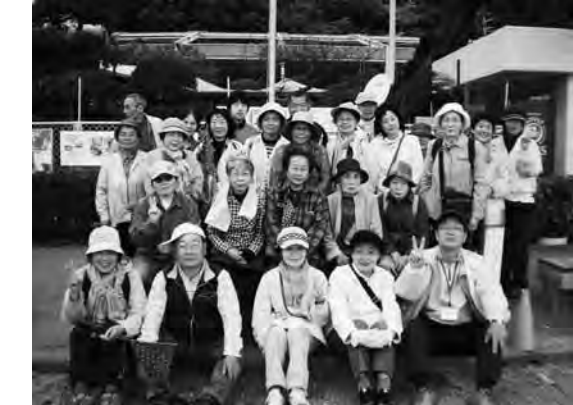
昼食後、桂浜で記念撮影

日高のオムライス街道に行ってみました。オムライスの上のソースが、いい香りがしておいしかったです。