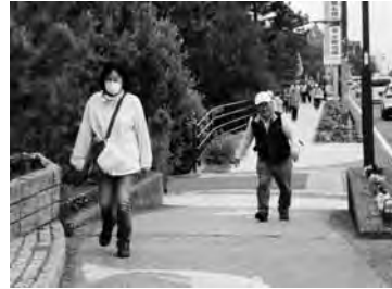
潮江ブロック「春を歩こう! 太平洋きらきらウォーキング」4月5日、27人で元親墓~花海道~浦戸~桂浜とさわやかに楽しみました!