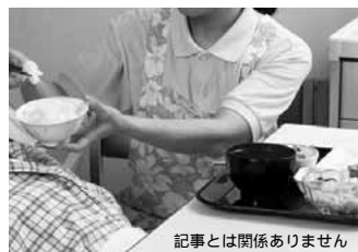
記事とは関係ありません

Aさんは寝たきり状態で食事をすると誤嚥性肺炎が起きて絶食になることもありました。が、肺炎が回復すると「ふりかけご飯が食べたい」と要望されました。家族も「食べたいという限りは食べさせてやりたい」という思いもあり、もう一度食事を取ることができないか、主治医、栄養士、リ