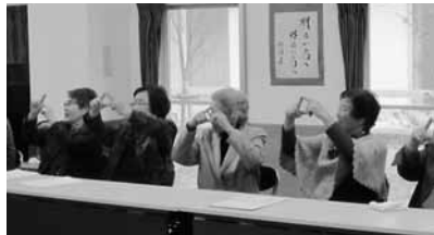
3月1日 春野支部配達員交流会 歌に合わせて指あそび、認知症予防につながります。