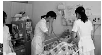
医療の現場で働くことを目指して、元気ががんばれる姿が印象的でした。