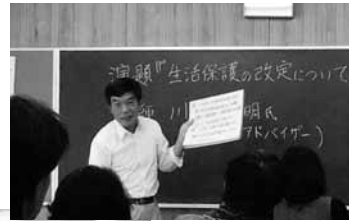
3月5日、佐川支部が「生活保護の改定について」と題して、学習会を行いました。生活保護基準額は最低限度の水準を決めたものであり、さらに引き下げられることは尊厳を否定され、生きることを失ってしまいます。