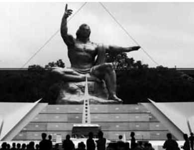
高知県代表28名、高知医療生協からは2名の職員が参加しました。