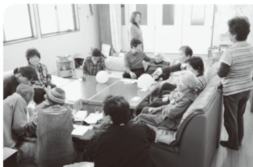
町内からボランティアスタッフも参加

高知市 匿名希望 NPT代表派遣へ、大変だと思いますが、私の分まで声を大にして参加をよろしく願っています。戦争は絶対反対です。今の政府のやり方は、とても心配です。私も行動しています。