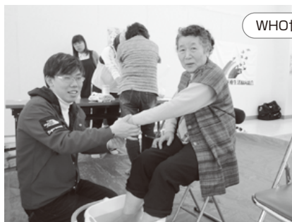
WHO世界保健デーinコープかもべ

春分の日、桜には少し早かったですが、道中、なの花が迎えてくれました。四万十街道ひな祭り、十和おかみさん市、郷土資料館「古溪城」を見ました。